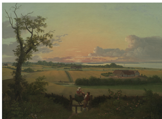
Christoffer Wilhelm Eckersberg Landskab med stente, Møn, 1810