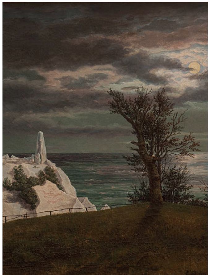
Frederik Sødring, Sommerspiret på Møns Klint, 1831, SMK

Efter eleverne har hørt musikken, kan de evt. læse baggrundsteksten om de to musikstykker, som findes på næste side.