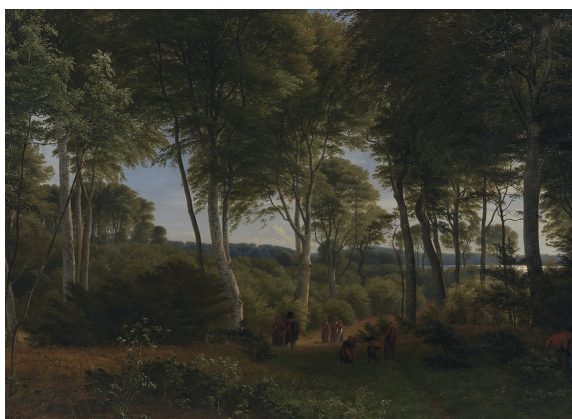
P.C. Skovgaard, Parti af Delhoved Skov ved Skarre Sø, 1847