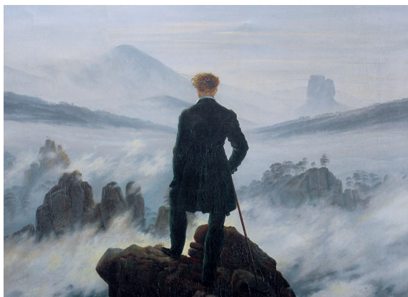
Casper David Friedrich Vandrer over tågehavet, 1817

Eleverne inddeles i mindre grupper, som arbejder med nedenstående malerier. Malerierne findes i stort format i billedbanken.