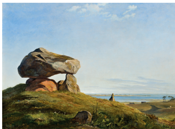
Johan Thomas Lundbye En gravhøj fra oldtiden ved Raklev på Refsnæs, 1839